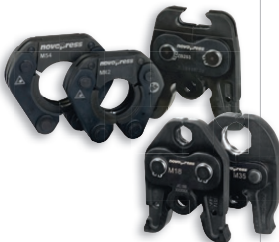
Пресс-клещи и пресс-кольца